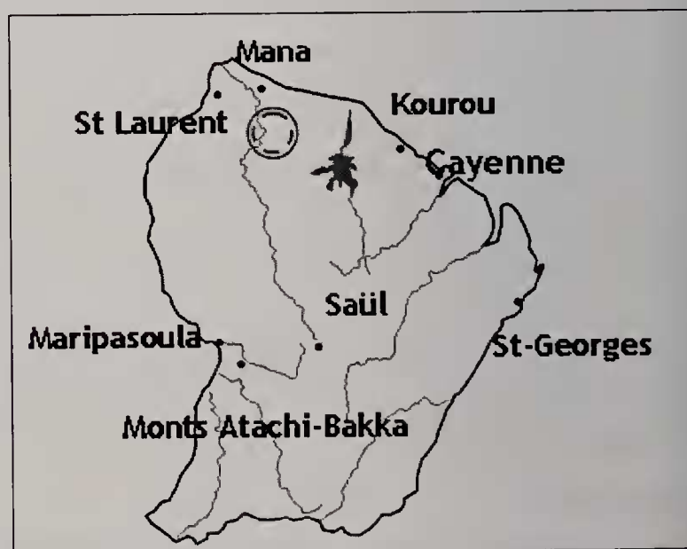
Fig. 1 : distribution géographique de Selenipedium chironianum

Selenipedium chironianum est à ce jour connu uniquement de la localité type (Fig. 1), qui couvre une superficie de 1-1,5 hectare et correspond à une forêt primaire haute sur sable blanc. Ce site est caractérisé par une composition floristique très riche et diversifiée. Les plantes poussent à une altitude de 10-30 m au-dessus du niveau de la mer. La floraison, in situ , peut s'étaler tout au long de l'année avec une période plus marquée de décembre à mars. En culture, les périodes de floraison semblent identiques. Les plantes semblent s'auto-féconder rapidement et ont rarement été vues sans fruits alors que la présence d'insecte pollinisateur n'a jamais été observée.